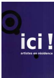
Ici, artistes en résidence, Abbaye-aux-dames, Caen, 2010